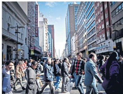
Pocos argentinos están felices con su trabajo

SONDEO. Tres de cada cuatro empleados están conformes con su empleo; los mayores de 50 lo valoran más